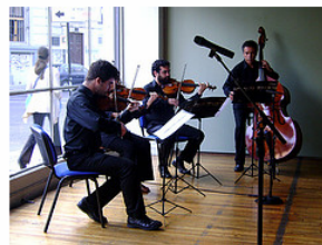
Inauguración Guayasamín en Chile, 1969. Sala El Farol