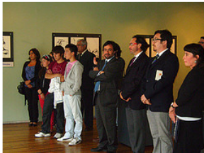
Inauguración Guayasamín en Chile, 1969. Sala El Farol