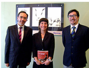
Inauguración Guayasamín en Chile, 1969. Sala El Farol